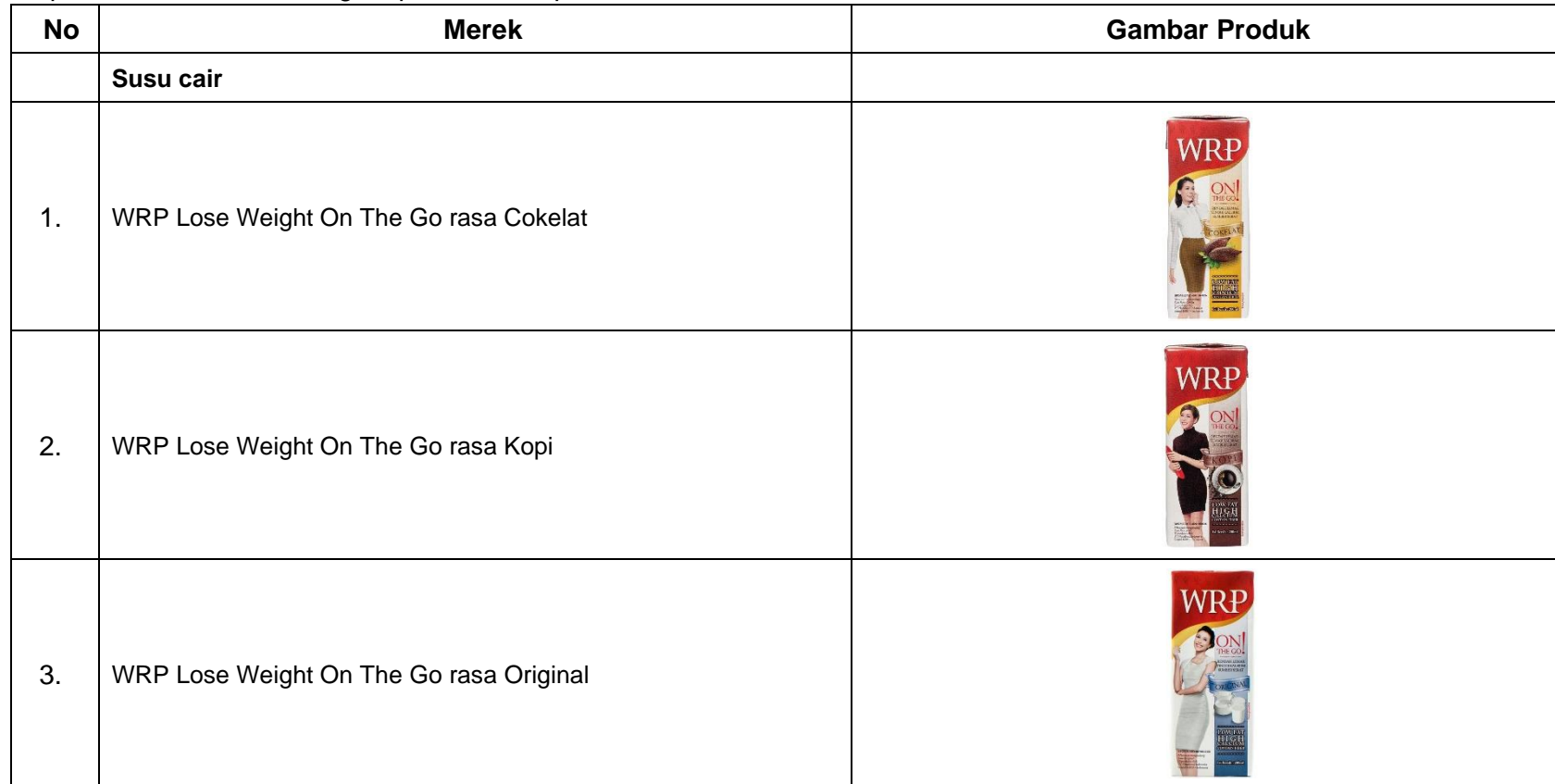
Lampiran 1. Dokumentasi ragam produk susu penurun berat badan