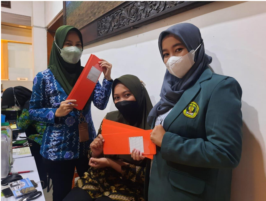
Lampiran 6. Implementasi Tracer .