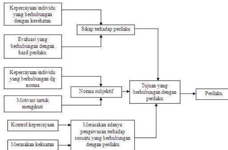
Gambar 2.1.2 Theory Of Reasoned Action & Theory Of Planned Behavior (TPB)